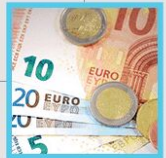
Prüfung der Bonität der Interessenten