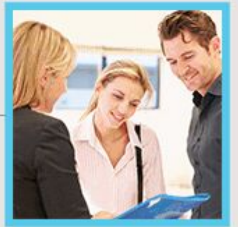
Verhandlungen mit den Interessenten