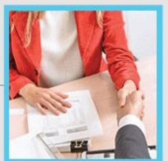
Betreuung nach Vertragsabschluss