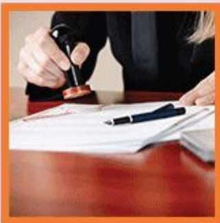
Ausarbeitung des Vertrages beim Notar (im Verkaufsfall)