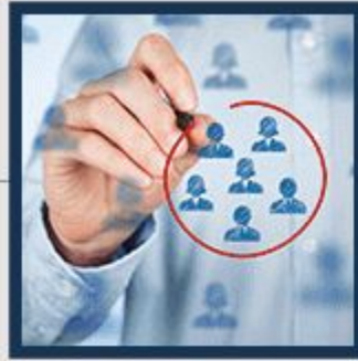
Ermittlung der perfekten Zielgruppe