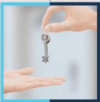
Übergabe des Objektes