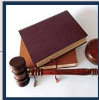
Unterstützung bei der Klärung rechtlicher Fragen