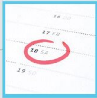
Organisation der Besichtigungstermine