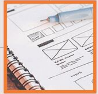
Erstellung eines aussagekräftigen Exposés