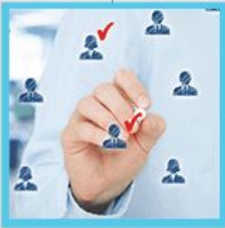
Vorauswahl der Interessenten