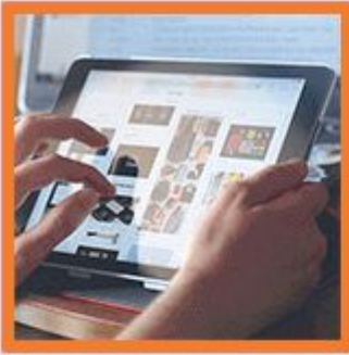
Vermarktung des Objektes online und offline